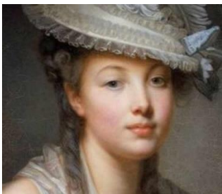
Olimpia de Gouges

Agora ben, Olimpia de Gouges, escritora e filósofa, promoveu a Declaración Universal dos Dereitos da Muller e da Cidadá que, xunto coas súas posicións políticas, a levaron á guillotina.