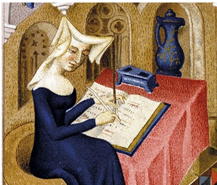
“Soíña estou e soíña quero estar”

Pasou á historia como a primeira escritora francesa que viviu da súa profesión. Escribiu tratados de filosofía, de política e de poesía.